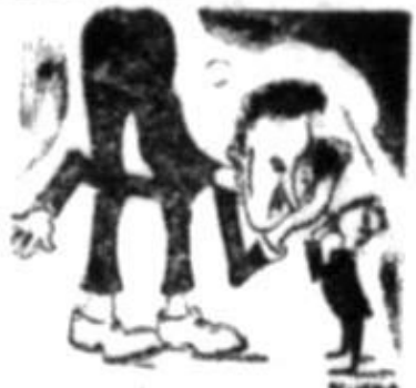
ȘTIȚEVA? NU PĂ PROȘT NU MAI ASQULTĂRĂNGLANSA SI QVETĂLQUR